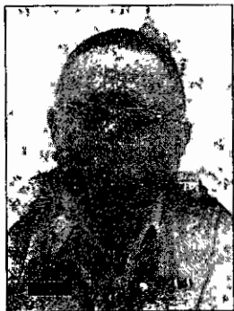
วัลย์ สุทธิธรรม

รวมถึงการไม่สามารถชี้แจงให้ประชาชนเข้าใจและเชื่อมั่นในการจัดการเลือกตั้งของ กกต. ได้ ซึ่งภารกิจเหล่านี้ขณะนั้นอยู่ในความรับผิดชอบของท่าน รองเลขาธิการ วัลย์ ทั้งสิ้น