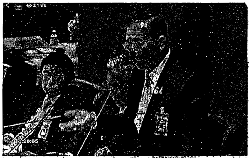
แจกปม 3 ปี - พล.อ.ประยุทธ์ จันทร์โอชา นายกรัฐมนตรี และ พล.อ.ประยุทธ์ จันทร์โอชา นายกรัฐมนตรี และ พล.อ.ประยุทธ์ จันทร์โอชา นายกรัฐมนตรี จากการทำพรรคฝ่ายค้านสอบตามกรณีใช้เวลาเตรียมรัฐประหาร 3 ปี โดยชี้แจงว่าเป็นการเตรียมฝึกกำลังพลเพื่อดูแลประชาชนช่วงเกิดความขัดแย้งรุนแรง ทรูสปากา เมื่อวันที่ 26 กรกฎาคม