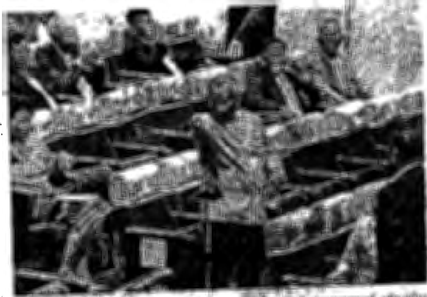
สงฆ์ พุทธศาสนิกชน และประชาชน ร่วมกันรณรงค์ต่อต้านการทุจริตคอร์รัปชัน ส.ส. มหสารัตน์ พรรคเพื่อไทย ที่อภิปรายถึงที่มาของ ส.ว. จนเกิดกวาดต้อนปากต่อคำถึงขนาด ทำวางมวย ระหว่างการประชุมแถลงนโยบายรัฐบาล เมื่อวันที่ 26 กรกฎาคม.