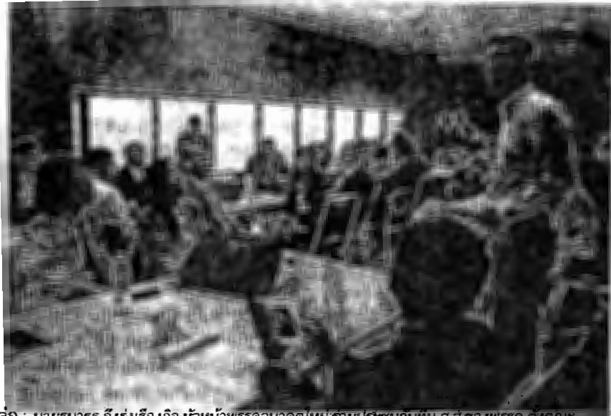
ลุยต่อ - นายธนธร จีรุงเรืองกิจ หัวหน้าพรรคอนาคตใหม่ ร่วมประชุมกับทีม ส.ส.ของพรรค ตั้งคณะกรรมการจัดการปัญหาความเดือดร้อนของประชาชน จำนวน 7 คน เพื่อรับเรื่องร้องเรียน โดยจัดการส่งต่อให้กับ ส.ส.ที่เกี่ยวข้องไปทำการแก้ไขต่อ ที่ห้องรับรอง ส.ส.พรรคอนาคตใหม่ อาคารรัฐสภา เกียกกาย เมื่อวันที่ 14 สิงหาคม