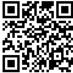
ทต.เขาค้าวช้าง