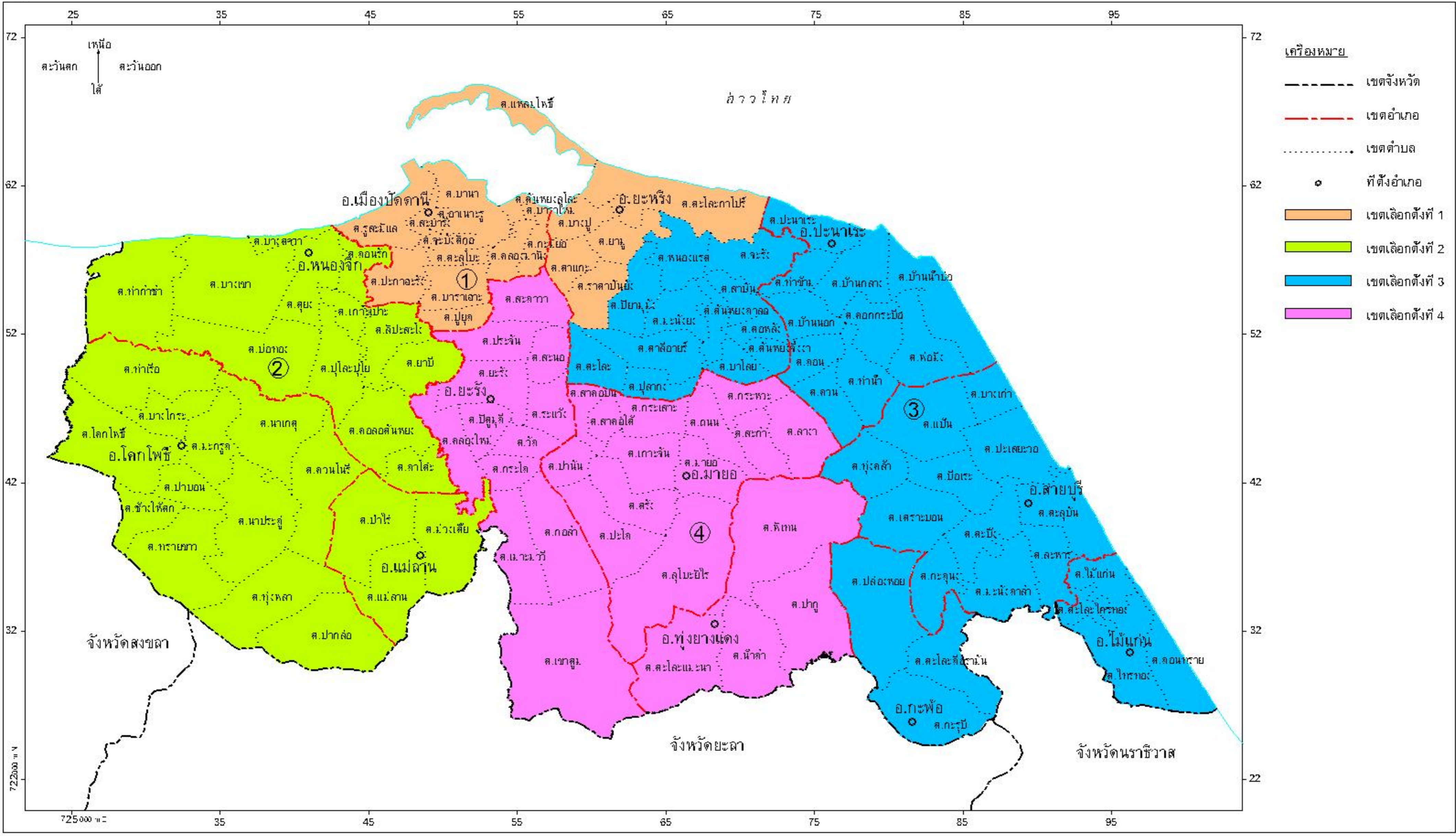
รูปแบบที่ 2